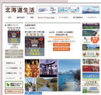
「北海道生活」ホームページ

さらに、「北海道生活」の情報は、インターネットを通して全国や世界へと発信していきます。また、北海道の市町村のエリア情報や、ブログやSNS、メールマガジンなど、“現在の北海道”をリアルに発信することができます。